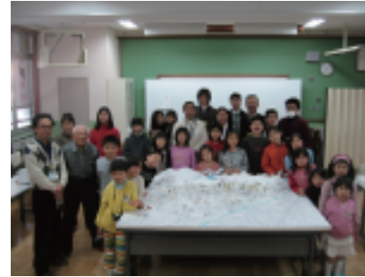
→三月十五日